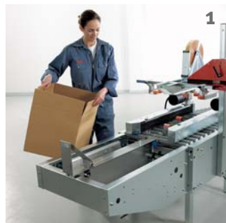
Auffalten des Kartons.

Der F-100 wird vor dem Kartonverschließer montiert und ist auch mit automatischem Vorschub des gefüllten Kartons lieferbar (F-100-P).