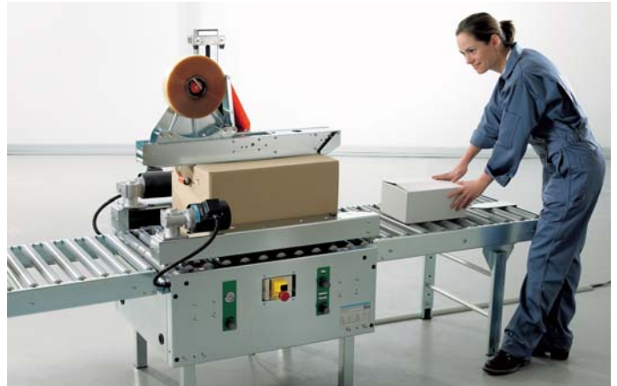
Der T-55 ist für Packstationen mit vielen verschiedenen Kartongrößen geeignet.