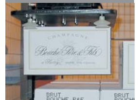
Bouché Père & Fils, Frankreich