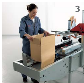
Der Karton wird auf der Schiene abgesetzt und zum Endanschlag geschoben, Längsklappen werden automatisch eingefaltet.