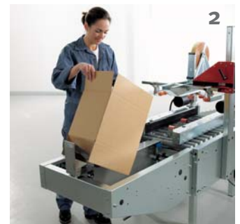
Bodenklappen der Schmalseite werden durch schräges Aufsetzen eingefaltet.