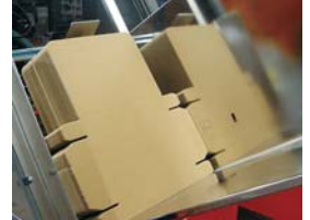
Geberit AG, Schweiz