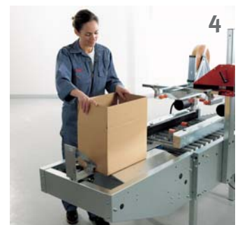
Der Karton ist nun fixiert und bereit für den Befüllvorgang.