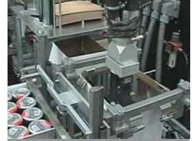
Sig. Ágústsson, Island