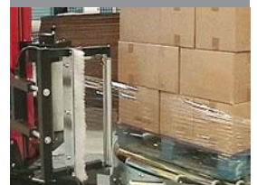
United Milk, Großbritannien