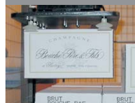
Bouché Père & Fils, Frankrig