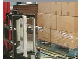
United Milk, England