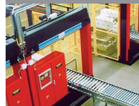
Altmark Käserei, Germany