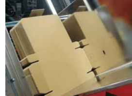
Geberit AG, Schweiz