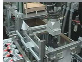
Sig. Ágústsson, Island