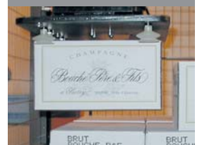
Bouché Pere & Fils, Franciaország