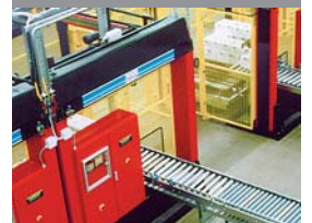
Altmark Käserei, Németország