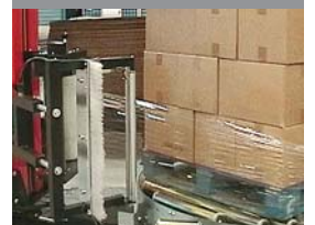
United Milk, Egyesült Királyság