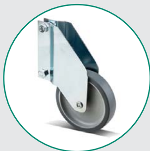
Støtthjul EI-100 PTE