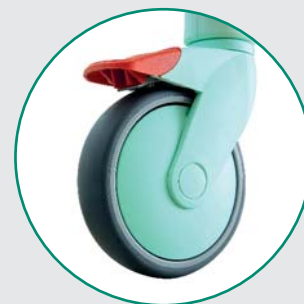
Tango hjul i specielle farver og en monteringsstap.